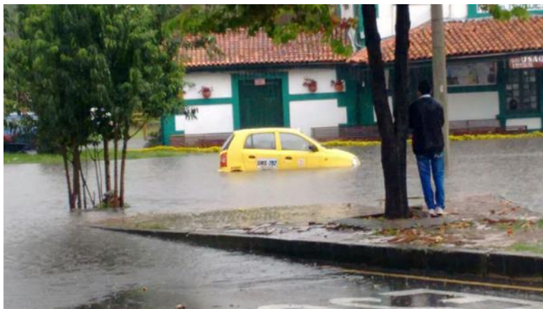
SITUACIÓN No. 1

En mayo 14 de 2017, se presentó un evento de inundación con afectación a 5 predios en la avenida 9 con calle 110, revisando la cartografía del sector, existía un cuerpo de agua que bajaba por detrás del complejo Hotelero Radisson, el cual fue modificado durante la construcción del centro de negocios internacional de este sector. Este vallado perdió su capacidad hidráulica y con las lluvias fuertes que se han presentado, el agua viene por escorrentía por los cerros orientales de Santa Ana oriental, calles 110 y 113 y pasa por la carrera 7ma hasta la carrera novena, inundando los dos ejes viales, la bahía del centro comercial santa Ana, y afectando la movilidad de la carrera 11.