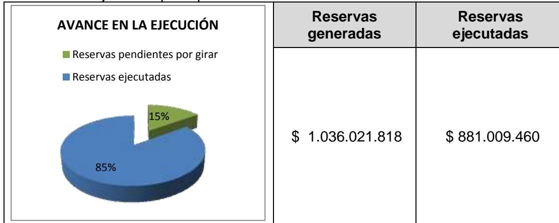
Tabla 1. Ejecución presupuestal de reservas corte 30 de noviembre de 2018