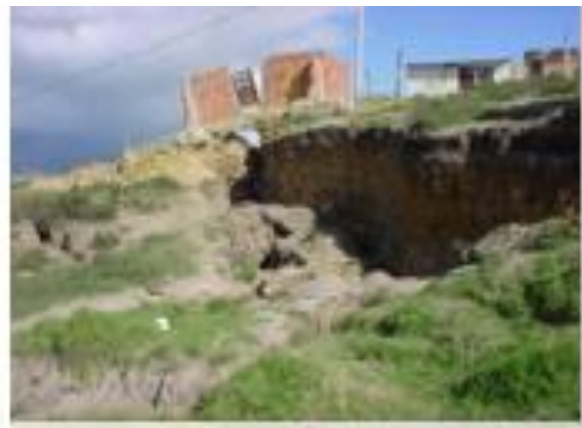
Evidencia fotográficas de la zona en el proceso de reasentamiento IDIGER