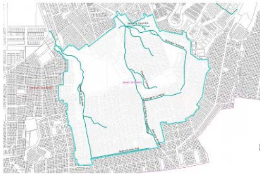
Polígono y barrios circundantes*