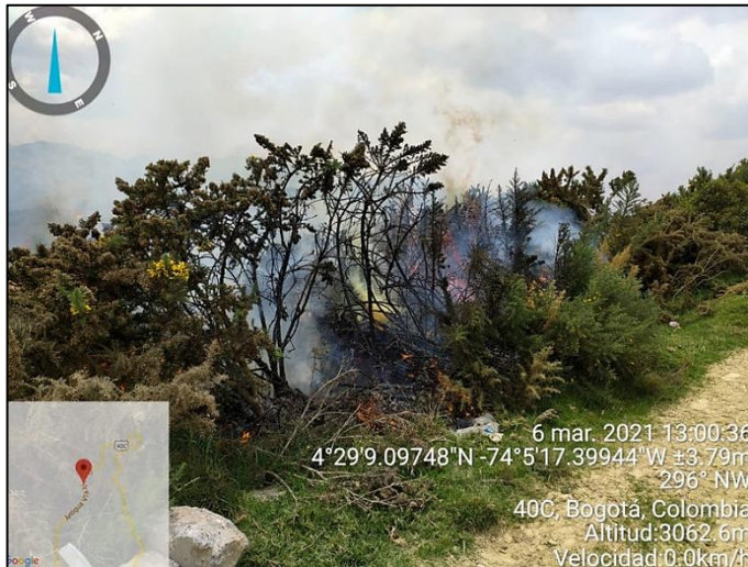
Ilustración 2. Conato de Incendio Forestal Vereda Soches 2021