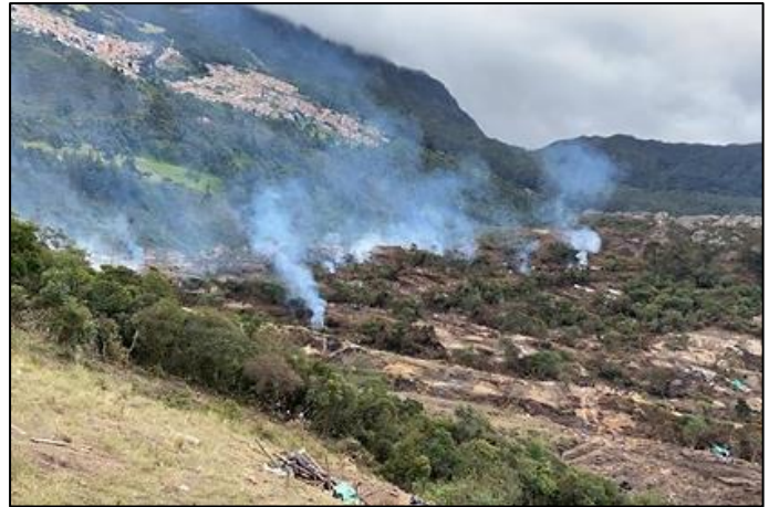
Ilustración 1. Conato de Incendio Forestal Sector La Esmeralda 2020