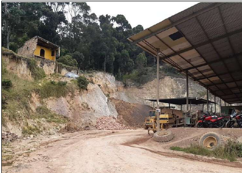
Ilustración 2. Estado Actual Ladrillera Gresqui – SDA – FDLU – Visita Octubre 2021