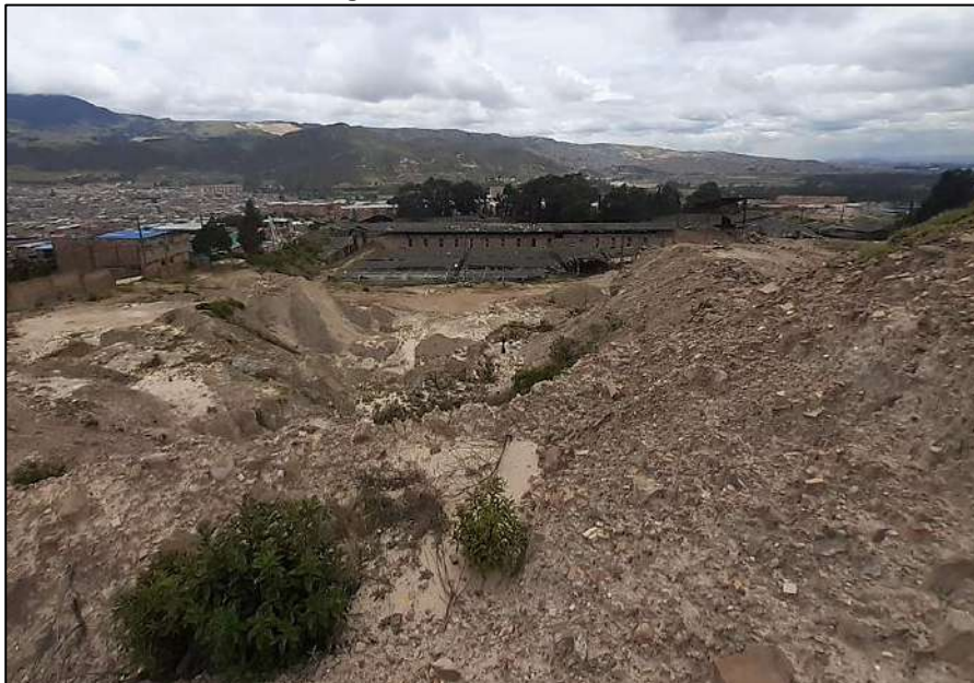
Ilustración 3. Explotación, beneficio y transformación de materiales arcillosos para la elaboración de ladrillo (Estado actual: PMA en conflicto jurídico)