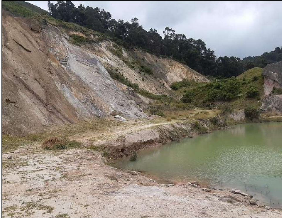
Ilustración 1. Antiguo Reservorio Ladrillera Alemana - SDA - FDLU