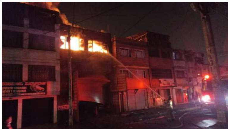
Figura 2. Incendio estructural presentado Enel Barrios 7 de agosto, el 22 de noviembre de 2021.