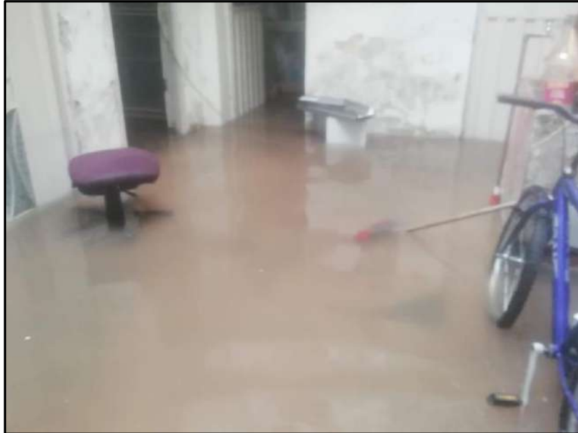
Barrio Villa Gladys, inundación, 2021.