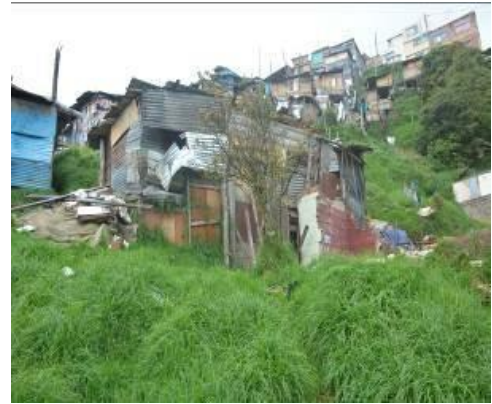
Foto No. 5 y 6. Condición actual de las viviendas 1 y 2 a 23 de Mayo de 2018