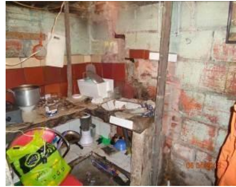
Foto No. 4. Grietas en muros perimetrales vivienda 2