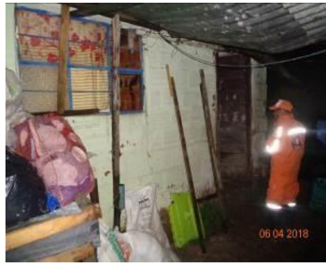
Foto No. 3. Vista frontal vivienda 2