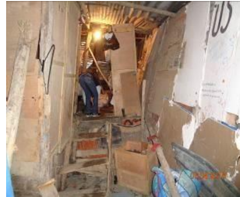
Foto No. 2. Vista interior de la vivienda 1