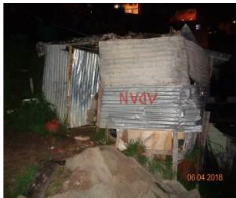
Foto No. 1. Vista frontal de la vivienda 1