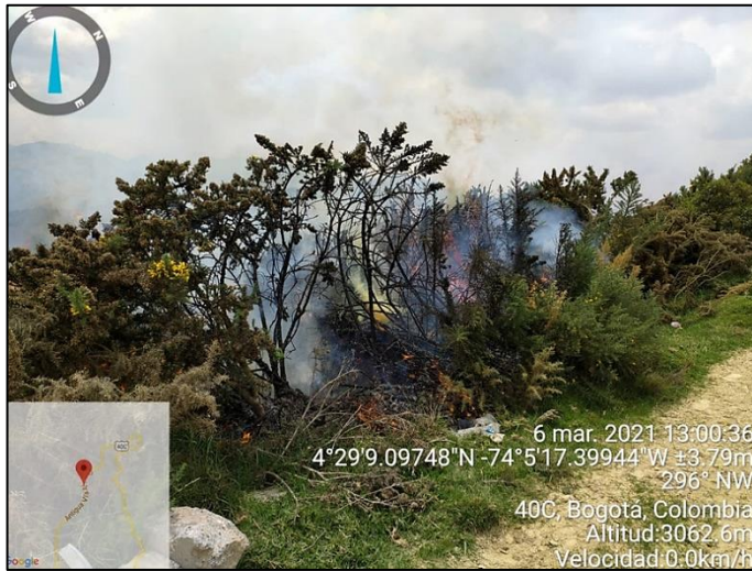
Ilustración 2. Conato de Incendio Forestal Vereda Soches 2021