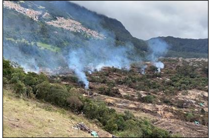
Ilustración 1. Conato de Incendio Forestal Sector La Esmeralda 2020