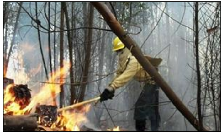
Ilustración 3. Control de Incendio Forestal Parque Entrenubes 2020