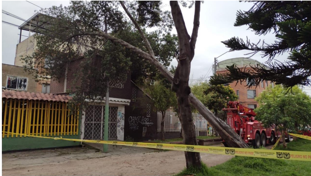
Barrio Paris Gaitán, Caída de individuo arbóreo, 2021.