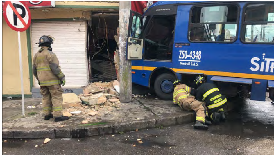
Barrio Villa Luz, choque de vehículo de transporte público contra local comercial en zona residencial, 2021.