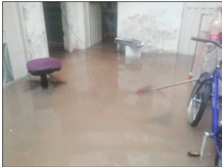
Barrio Villa Gladys, inundación, 2021.