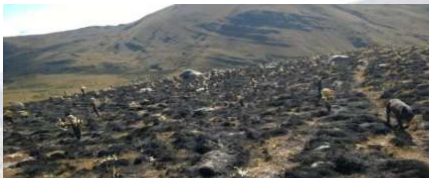
Incendio Vereda Las Vegas 2016

Revisando las bases de datos de incendios forestales en la Localidad que maneja el Cuerpo Oficial de Bomberos, no se tiene registro de incidentes causados por factores naturales, como lo podrían ser las tormentas eléctricas.