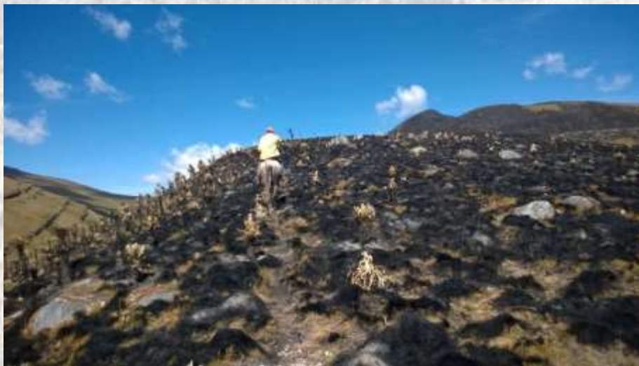
Fuente: Archivo fotográfico Parques Nacionales Naturales. Incendio Vereda Las Vegas 2016

b) Incidencia de la resistencia: La presencia de vegetación invasora como el retamo espinoso 15 facilita el desarrollo del incendio por sus propiedades pirogénicas, y por su impacto en los ecosistemas, afectando cuerpos de agua, suelos y el crecimiento de especies endémicas presente en el ecosistema como los frailejones, los pajonales, rosetas y musgos, que además se caracterizan por un lento crecimiento, las cuales ante el fuego, mueren rápidamente, afectando los ecosistemas bosque Alto Andino, Subpáramo y Páramo.