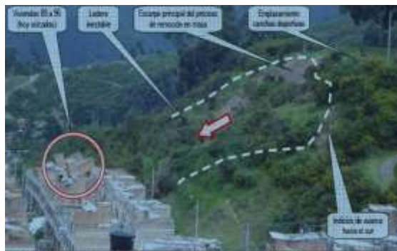
Vista de la urbanización Buena Vista Oriental III Etapa afectada