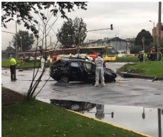
Fotografía accidente de tránsito Chapinero, tomada de Tiempo.