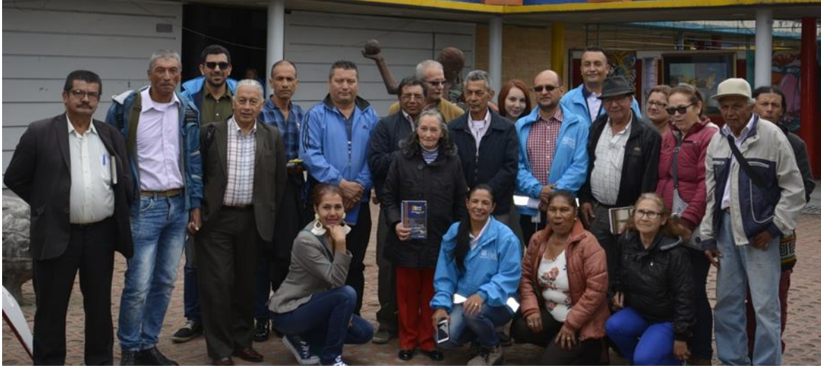
Fuente: proceso de elecciones Delegaciones IDIGER 04 mayo 2019