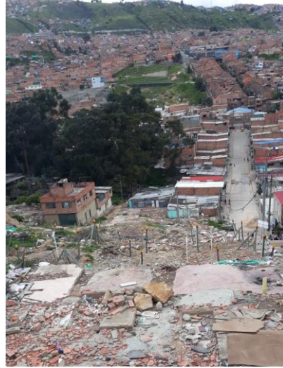
Emergencia Divino Niño Alcaldía Local CB mayo 2019