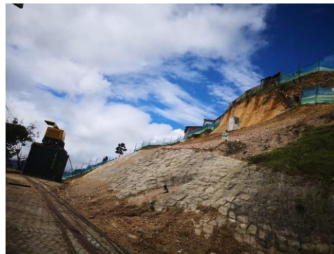
Brisas del Volador Fondo de Desarrollo Local CB mayo 2019

Zona de amenaza por remoción en masa, falta de control policivo para adelantar vigilancia de las nuevas ocupaciones ilegales pues es una zona declaradas en alto riesgo no mitigable, la zona cuenta con predios reubicados por EAB, IDIGER y CVP, las viviendas subnormales presentan deficiencias estructurales y son generadores de afectaciones por el mal manejo de aguas servidas de la mayor parte de las viviendas no tienen manejo de aguas pluviales. Por parte del IDIGER y el Fondo de Desarrollo local se desarrollaron acciones de reducción para este punto.