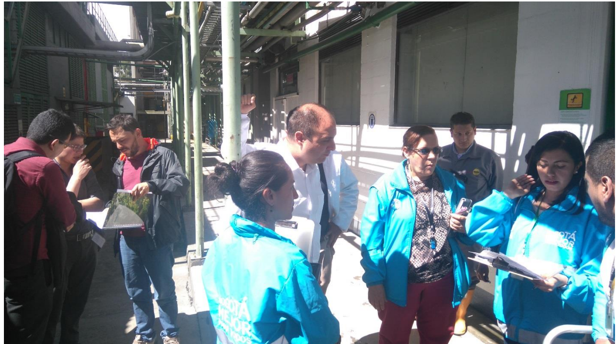
Revisión institucional del incidente en la empresa.

Al presentarse el evento se activa el Sistema Distrital de Emergencias en los roles de cada una de las entidades a que pertenecen. Hicieron presencia Bomberos Fontibón, Secretaria Distrital de Ambiente y Secretaria Distrital de Salud, con el objetivo de evaluar las afectaciones a los trabajadores y a la calidad del aire y establecer zona segura.