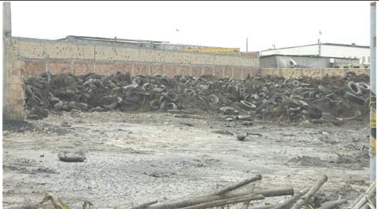
Incendio de llantas en bodega de Fontibón.