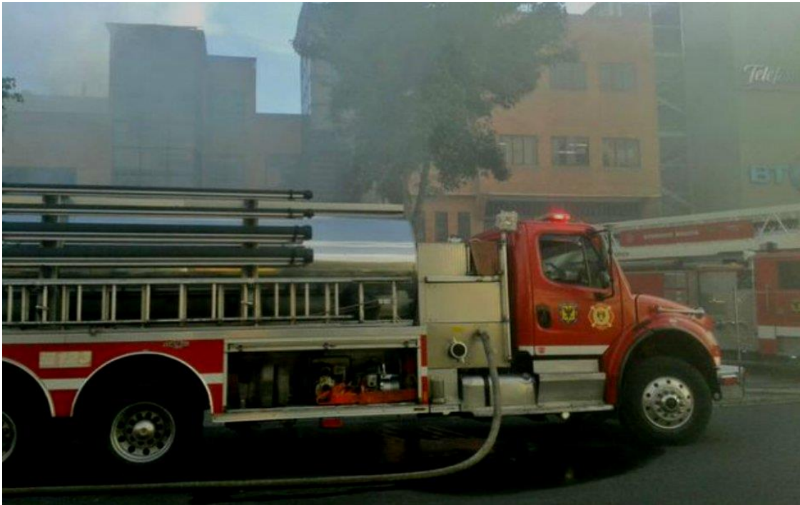
Incendio de bodega de almacenamiento de empaques plástico en Fontibón. Cra106 con calle 15 A Agosto 20 de 2015.