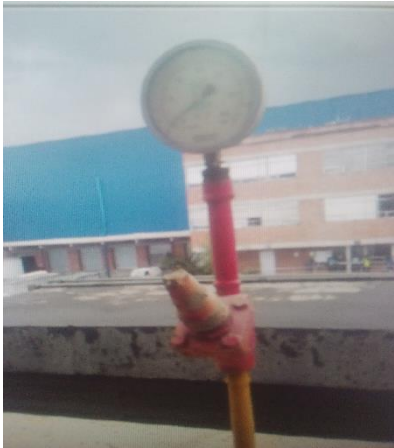
Manómetro averiado. 4 de mayo de 2017