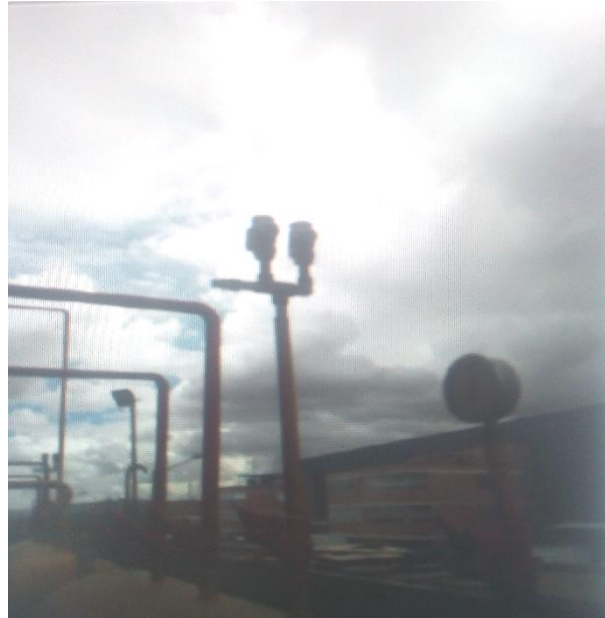
Fuga de amoníaco y vapor de agua.

debe tener en cuenta que en este programa es de obligatorio cumplimiento incluir a las comunidades cercanas a las empresas con el fin de que se establezcan unas condiciones mínimas de seguridad y protección contra los riesgos tecnológico del sector. Estas medidas deben conducir a reducir la vulnerabilidad de transeúntes del sector, trabajadores de la empresa y de las industrias adyacentes. Las autoridades distritales deben vigilar para que las empresas del área cumplan con la normatividad vigente relacionada con la prevención, operación y seguridad de incidentes tecnológicos debido al carácter empresarial del polígono y a las actividades y sustancias que manejan en sus procesos industriales y en su entorno, tales como almacenamiento de material combustible, líquidos inflamables y productos químicos.