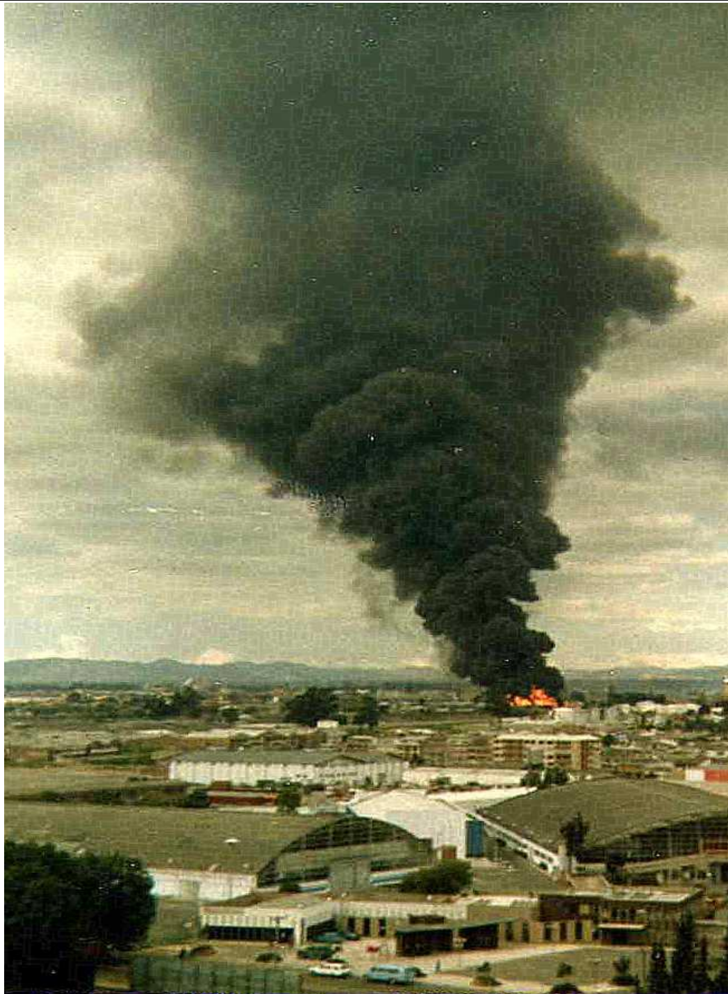
Incendio de los tanques de Puente Aranda, ocurrido el 13 de diciembre de 1982.