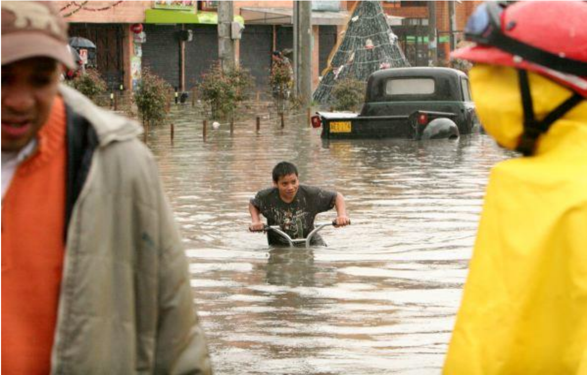
Inundación en Tierra Buen, Kennedy. Noviembre 2011.