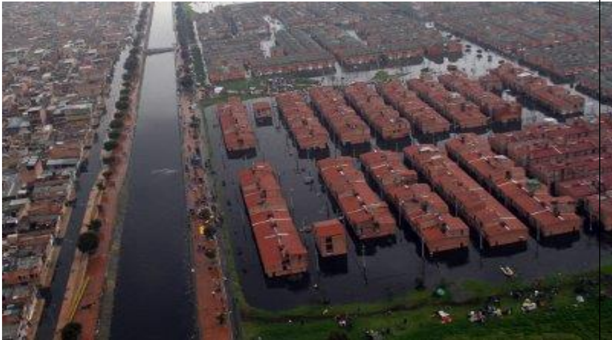
Inundaciones en los barrios Patio Bonito, Tierra Buena y Bellavista, en las localidades de Kennedy, en Bogotá, a inicios de diciembre del 2011.

De igual manera la permanente urbanización y el crecimiento desordenado de sectores de la población, en el polígono donde se presentó la inundación, exige mayor intervención planificada del territorio debido a la demanda de servicios públicos que ello acarrea para su ordenado desarrollo.