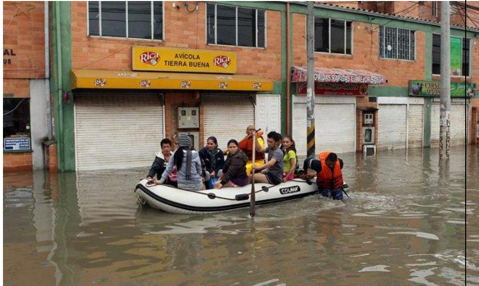
Familias salen de sus viviendas, después de que el río Bogotá se desbordase e inundara el barrio Patio Bonito en Bogotá. Las fuertes lluvias que afectan a Colombia han causado 134 muertos y tienen en emergencia a la capital, donde las inundaciones han afectado a unas 50.000 personas.

En las personas: Si en el evento de 2010-2011 se contabilizaron 47.000 damnificados, 17.366 hogares afectados, 2.258 viviendas inundadas. Hoy en día los daños serán mayores debido que la población se ha duplicado en las UPZ del Tintal, Patio bonito y Calandaima debido a que actualmente existe un mayor desarrollo urbano en la localidad.